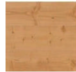
オスモ UV オイル塗装 (チーク) PHFL0291