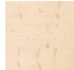
オスモ UV オイル塗装 (バニラ) PHFL0289