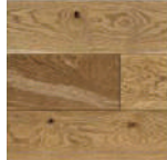
ウレタン塗装 (セサミ) PHFL0200