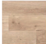
ウレタン塗装 (ミルクティー) PHFL0202