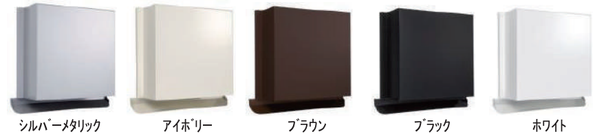
シルバーメタリック