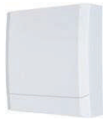
【スイッチ付排気用壁付ファン】