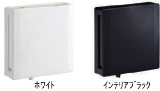
【給気用壁付ファン】